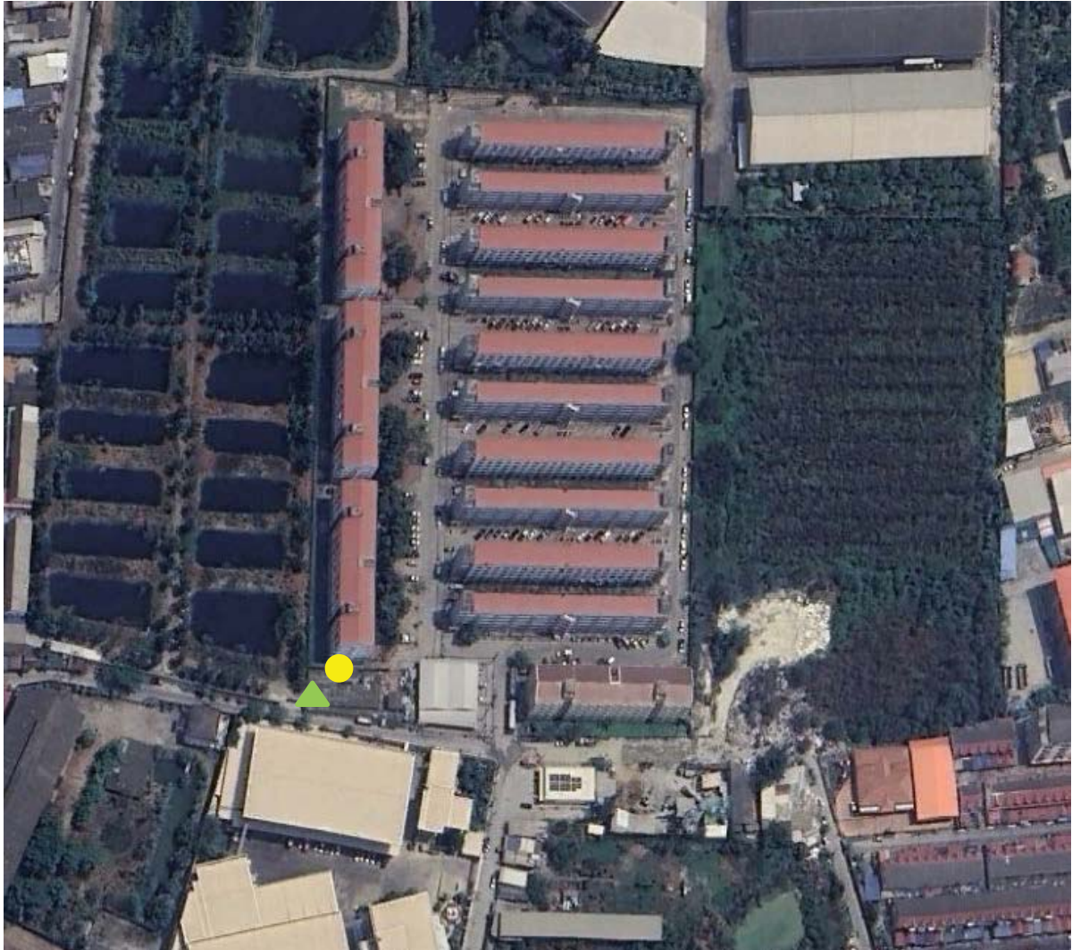
รูปที่ 3-1 ตำแหน่งตรวจวัดคุณภาพสิ่งแวดล้อม